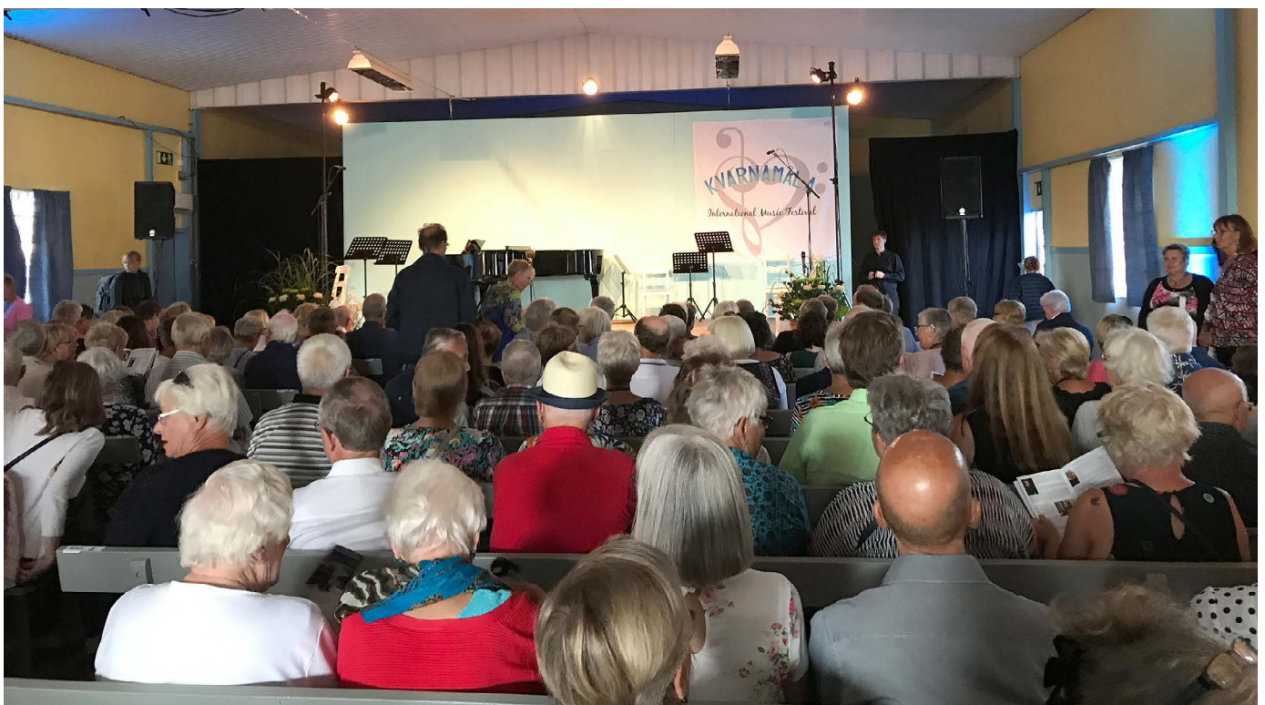
Konsertsalen i Kvarnamåla International Music Festival.